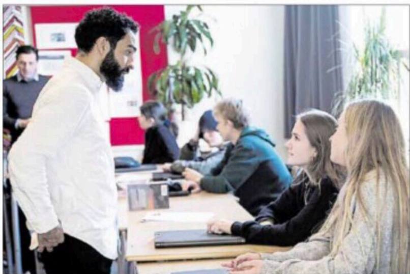
Mahmouds beretning om fem storebrødre, der ville bestemme over ham, satte gang i snakken om social kontrol.